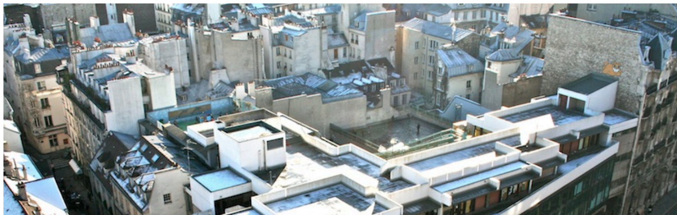
Vue aérienne (détail) de l'École Saint-Merri, prise du Centre G. Pompidou, 2009