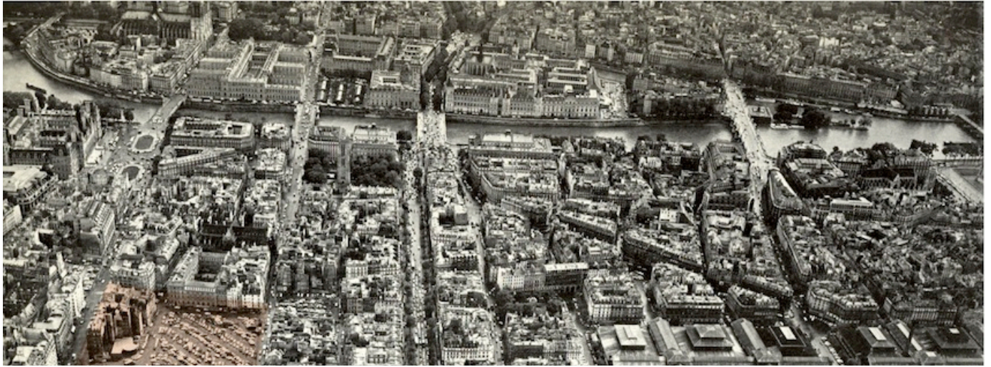
Vue aérienne (détail) du secteur lors de la consultation pour le Centre G. Pompidou, Paris-Projet 1972