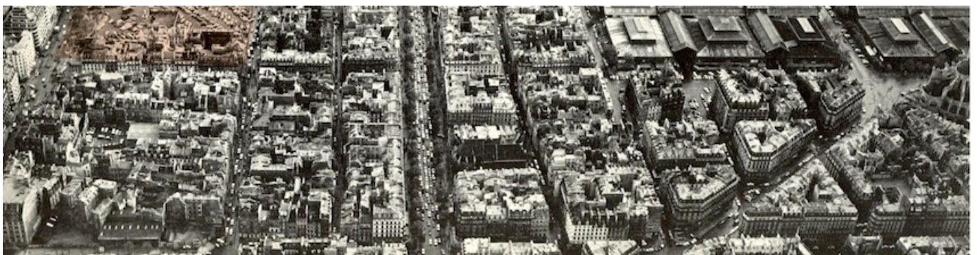
Vue aérienne (détail) du secteur lors de la consultation pour le Centre G. Pompidou, Paris-Projet 1972