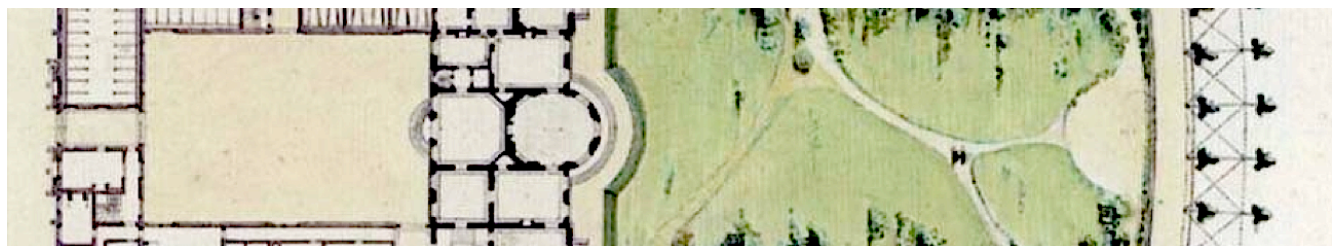
Hôtel de Bourbon-Condé, Musée du Louvre