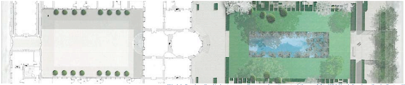
Hôtel de Bourbon-Condé, dessin agence Faragou : http://creasite.fr/faragou2/2/pdf/PJ-Hotel_Bourbon_Conde_Paris.pdf